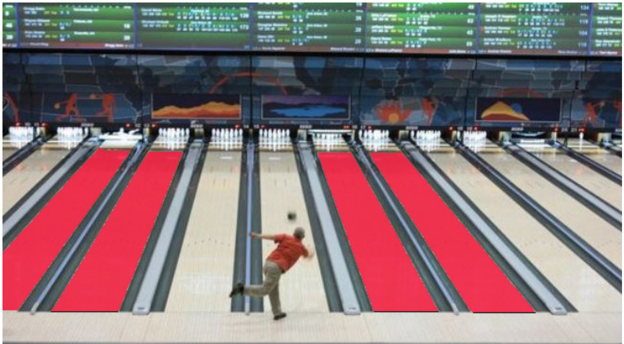
Double jump regel

Bowlers moeten ten allen tijde de “one pair lane courtesy” respecteren. Zij mogen evenwel geen achtereenvolgende worpen uitvoeren zonder dat ze de bowlers op het paar aan de linker- en rechterzijde de kans hebben gegeven om een worp uit te voeren. Behalve als deze niet klaar zijn of hun beurt afstaan.